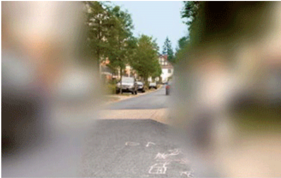
ภาพที่เห็นจากการมองผ่านเลนส์โทรเกรสซีฟทั่วไป มุมมองแคบ