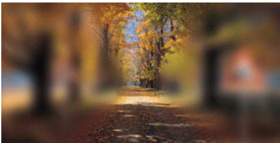
ภาพที่เห็นจากการมองผ่านเลนส์โปรเกรสซีฟที่ัวไป มุมมองแคบ

เป็นความจริงที่ว่า ทุกวันนี้ยังคงมีผู้ใช้แว่นตาจำนวนมาก เสียเงินหลายพันไปจนถึงหลายหมื่นบาทซื้อแว่นตาโปรเกรสซีฟที่ไม่สามารถใช้งาน ได้จริง ใส่แล้วเวียนหัว ส่วนใหญ่มักเกิดจากเลือกใช้เลนส์แว่นตาคุณภาพต่ำเทคโนโลยีอื่น อีกส่วนหนึ่งเกิดจากการตรวจวัดประกอบไม่ถูกต้อง