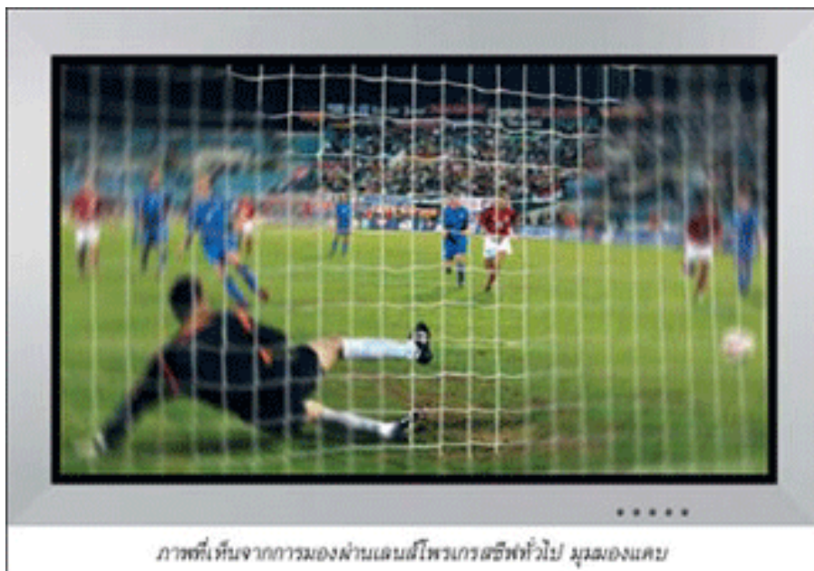
ภาพที่เห็นจากการมองผ่านเลนส์โปรเกรสซีฟทั่วไป มุมเองแคบ

ผมสร้างมาตรฐานสูงสุดของราคาเลนส์แว่นตา กรอบแว่นสายตา แว่นกันแดด ด้วยระบบ Fair Price = Same Price For Every One ไม่มีการบวกราคาเพื่อลดเหมือนร้านแว่นทั่วไป ลูกค้าเก่าหรือลูกค้าใหม่ ซื้ออันเดียวหรือซื้อลิบอัน ซื้อแอสเดียวหรือหลายแอส ได้ราคาเดียวกันหมด สินค้าทุกชิ้นรับประกันความพอใจแบบไม่มีเงื่อนไข 6 เดือนเต็ม และรับประกันคุณภาพการใช้งาน 2 ปีเต็ม จริงๆ แล้วเป็น “ Better Life guarantee ” นะ ใส่แว่นผมแล้วถ้าชีวิตไม่ดีขึ้น เอามาคืนได้ ผมควบคุมมาตรฐานการตรวจวัดสายตาประกอบแว่นโปรเกรสซีฟไฮเอนด์ด้วยตัวเองอย่างละเอียดทุกขั้นตอนเพื่อให้ได้แว่นตาที่ดีที่สุด ใส่สบายที่สุด ถ้าลูกค้าใส่แว่นตาแล้วบอกว่าใส่ไม่สบายแม้แต่ชนิดเดียวหรือในรายละเอียดปลีกย่อยที่สุด ผมจะต้องหาคำตอบให้เจอว่าทำไม ขณะที่ร้านแว่นทั่วไปมักไม่สนใจ ทำให้การทำงานไม่เหมือนกัน แต่ถ้าเป็นลูกค้าผม แว่นตาจะต้องสมบูรณ์แบบของผมนี่ถ้าเลนส์หลวม ลูกค้าเอาไปใส่ก็ไม่กระชับ ผมต้องทำให้ใหม่ ขาดทุนก็ต้องทำ เพราะถือว่าถ้ารับเงินลูกค้ามาแล้วต้องทำให้ดีที่สุด