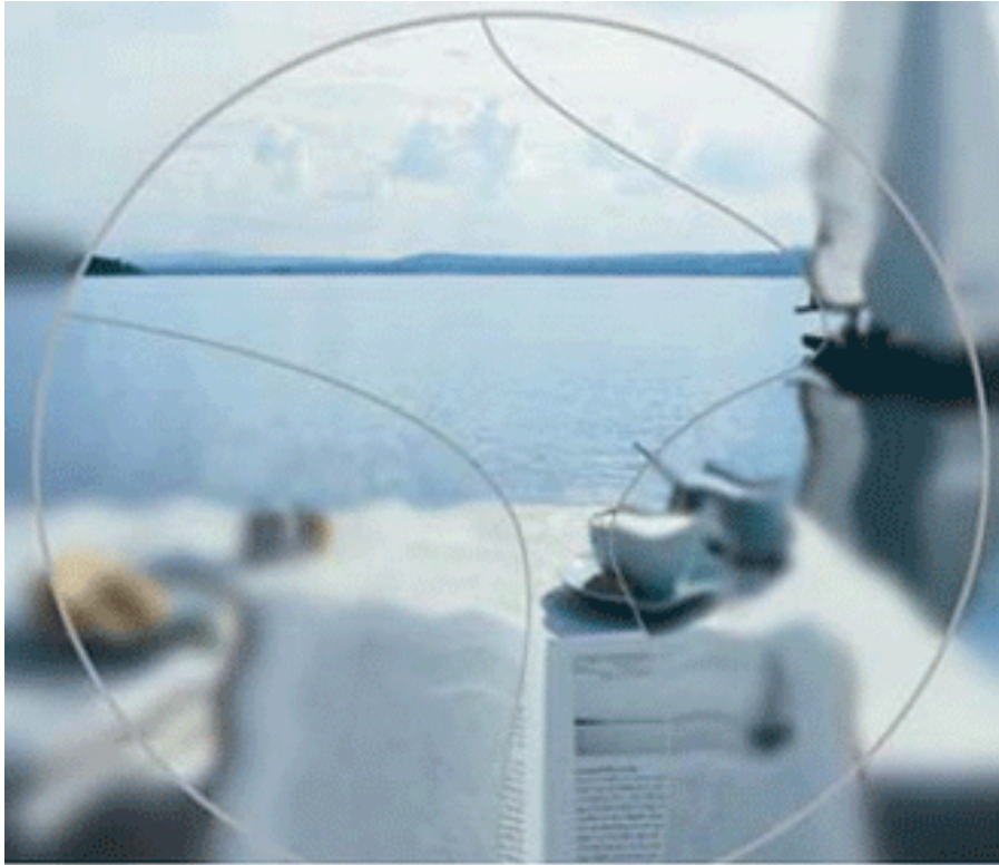
เลนส์โปรเกรสซีฟทั่วไป มุมมองแคบ ปรับตัวยาก

ร้านแว่นส่วนใหญ่ทั่วโลกขายเลนส์แว่นตาโปรเกรสซีฟคุณภาพสูงเหมือน ปรมาจารย์โบบิ หรือเปล่า