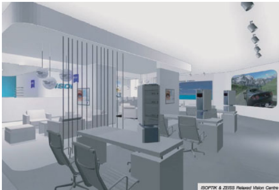
ISOPTIK & ZEISS Relaxed Vision Centre

ผมอยากจะดูแลสายตาของผู้คนตั้งแต่แรกเกิดจนถึงบั้นปลายของชีวิต โดยจัดให้มีศูนย์ดูแลสุขภาพสายตาเด็กเล็ก ศูนย์ดูแลสุขภาพสายตาเด็กวัยเรียน ศูนย์ดูแลสุขภาพสายตาคอนวีย์ทำงาน และศูนย์ดูแลสุขภาพสายตาผู้สูงอายุ Doctor of Optometry และจักษุแพทย์ งบประมาณในการลงทุนกว่า 300 ล้านบาท ภายใต้แนวคิด ไม่จ่ายยา ไม่ผ่าตัด ไม่วินิจฉัยโรค แต่เป็นศูนย์ตรวจสุขภาพสายตาเบื้องต้น และส่งต่อคนไข้ที่ทันสมัย โดยประสานงานกับจักษุแพทย์ผู้เชี่ยวชาญเฉพาะโรค เพื่อคุณภาพการมองเห็นที่ดีที่สุดของผู้ใช้บริการทุกท่าน ไม่ใช่แค่ให้มองเห็นได้ดีที่สุดเท่านั้น แต่เพื่อให้คงการมองเห็นที่ดีที่สุดไว้ให้นานที่สุด