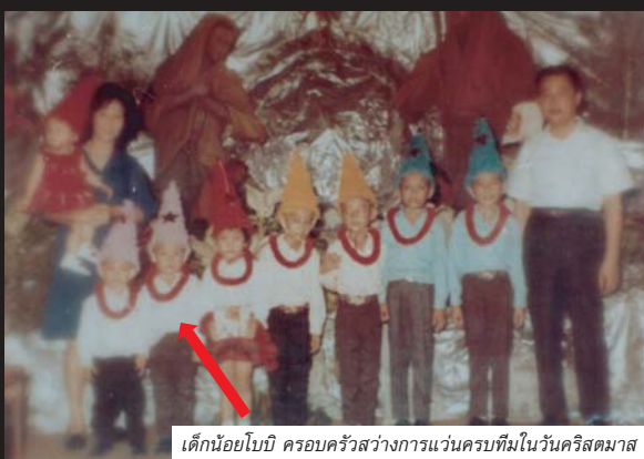
เด็กน้อยโบบี ครอบครัวสว่างการวันครบทีมในวันคริสต์มาส

เปล่าเลย ตั้งแต่เด็กผมรู้สึกอยู่ตลอดเวลาว่าผมเป็นลูกที่พ่อแม่รักน้อยที่สุดนะเมื่อเทียบกับลูกคนอื่น ๆ พี่น้อง 8 คนผมคนที่ 6 ชนมโหรีพระจันทร์หนึ่งขึ้น ต้องแบ่งกัน คือแบ่งเป็น 8 ส่วน พี่น้องทุกคนต่างคนต่างได้คนละส่วน ผมก็จะค่อย ๆ กิน นิ่งกินของผมไปอย่างมีความสุข พี่น้อที่กินหมดแล้วเขามาเห็นของผมยังเหลืออยู่ ก็จะมาแย่ง แต่ถ้ามาแย่งผมนะ ผมก็จะชกเอาเท่านั้นแหละ ชกคนตัวโตกว่าผมไม่รู้สึกลึคนะ แล้วเขาก็จะร้องไห้ไปฟ้องแม่ ถ้าไม่ให้ผมกินโดนตี คุณแม่บอกว่าทำไมเห็นขนมเด็กว่าพี่ทำอะไรไม่ให้พี่ เราเป็นน้องต้องเคารพพี่ โอเค...ตรงนี้ผมเข้าใจ แต่วันต่อมาน้องมาแย่งผม ผมไม่ให้ ผมก็โดนตีอีก แม่ก็บอกว่าเขาเป็นน้อง เราเป็นพี่ต้องให้น้อง เราก็เอ๊ย...อะไรเนี่ย เราเป็นน้องต้องยอมพี่ เราเป็นพี่ต้องให้น้องเอ๊ย...เราอยู่ตรงกลาง มันยังงั้นกันนะ รู้สึกว่าทำไมพ่อแม่ไม่รักเรา มีหลายครั้งที่เสียใจมากแอบไปนั่งร้องไห้คนเดียวได้เป็นวัน ๆ น้อยใจมากขนาดจนคิดหาวิธีฆ่าตัวตายสารพัดตามประสาเด็กสับสน คิดเอานิ้วเหยียบปลั๊กไฟก็ไม่กล้ากลัวเจ็บ กระโดดคลองห้วยยางก็เหมือน จะจริงให้รถชนก็สงสารคนขับต้องติดคุก คิดไปคิดมากกลัวไม่ตายแต่พิการ กลัวคนอื่นเดือดร้อนกลัวคุณพ่อคุณแม่โดนคนอื่นว่า "เลี้ยงลูกยังไม่ลูกถึงฆ่าตัวตาย" เลยไม่เอาดีกว่า (หัวเราะ) แต่พ่อแม่ยังย้อนกลับมา มันก็สมควรอยู่หรอก รับขนมมาแล้วจะกินให้หมดๆ ให้จบเรื่องแต่เราดินมานั่งละเมียดละไมก็เลยกลายเป็นปัญหา