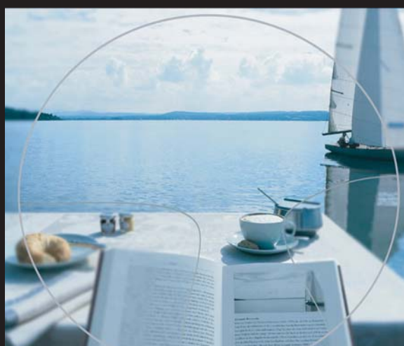
เลนส์โพเกรสซีฟระดับไฮเอนด์ ให้มุมมองกว้างที่สุด