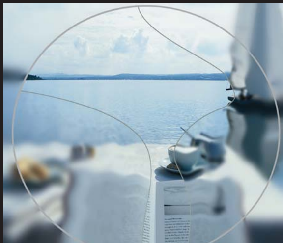
เลนส์โพเกรสซีฟทั่วไป มุมมองแคบ ปรับด้วยยาก

เลนส์โพเกรสซีฟรุ่นเก่าที่ใช้เทคโนโลยี 30ยูนิตที่แล้ว ต้องหัดใส่กันเป็นเดือน เดี่ยวนี้ก็ยังต้องมีขายอยู่ คู่ละพันก็มี แต่เลนส์โพเกรสซีฟรุ่นใหม่ใส่แล้วชัดแจ้วเลย ไม่ต้องรอปรับสายตา ราคาผมให้เลือกตั้งแต่คู่ละ 35,000 บาท