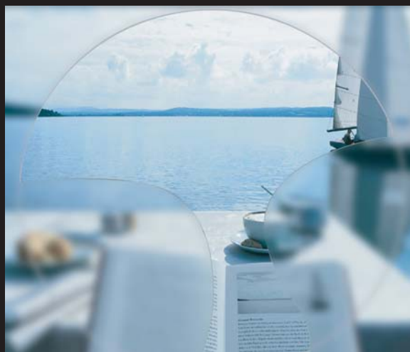
เลนส์โพเกรสซีฟเทคโนโลยีใหม่ ให้มุมมองกว้างขึ้น