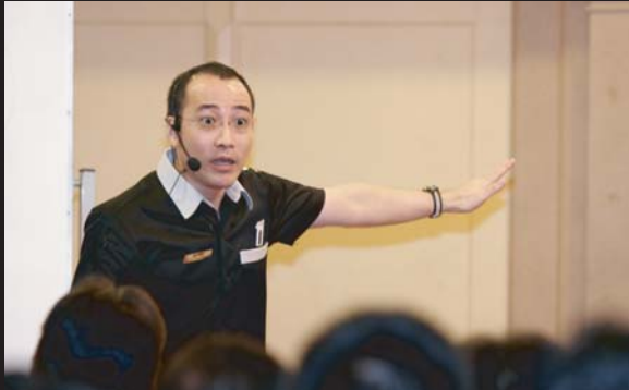
ลีลาการสอนแบบถึงลูกถึงคนของโบบี ในหลักสูตรแว่นโทรเกรสซีฟที่คู่มือที่พลิกโฉมวงการ

ใครๆ มักมองคุณว่าเป็นคนแปลก ตรงไปตรงมาจากหน้าแล้ว และมั่นใจเกินเหตุจริงๆ แล้วคุณโบบีเป็นคนแบบไหน