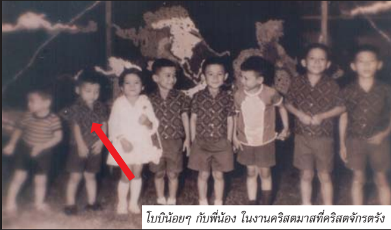
โบบีน้อยๆ กับพี่น้อง ในงานคริสต์มาสที่คริสตจักรตั้ง

แต่หน้าผากพาดผ่านหัวตาและจมูกขาดร่องแรงถึงริมฝีปาก แผลผมคงติดเชื้อ พอลออกจากโรงพยาบาล เลยเป็นไชนส์ล็อกเสกชั้นรุนแรงมาก ปวดตลอดเวลา