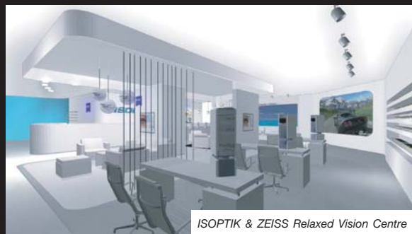
นอกจากฝันเรื่องศูนย์แว่นตาไฮเอนด์ที่ใหญ่และดีที่สุดในโลกแล้วยังมีความฝันอื่นอีกไหม

เยอะมาก ทุกวันนี้ผมยังคงมีความฝัน มีเป้าหมายสำคัญแน่นอนที่จะทำให้สำเร็จ ฝันอยากขยายศูนย์แว่นตาไอชอปติกให้มีห้องตรวจวัดสายตา 100 ห้อง มี Doctor of Optometry ประจำ 100 ท่าน มีจักษุแพทย์ผู้เชี่ยวชาญเฉพาะทางครบทุกโรค เพื่อรองรับผู้ใช้บริการจากทั่วโลกได้อย่างสะดวก รวดเร็ว มีคุณภาพดีที่สุดในโลกได้ไม่น้อยกว่าวันละ 1,000 คน เป็นศูนย์รวมเลนส์แว่นตาระดับไฮเอนด์ที่ดีที่สุดในโลก มีกรอบแว่นคุณภาพสูงทุกแบรนด์ทุกรุ่น ทุกคอลเลกชั่น บนพื้นที่ 10,000 ตารางเมตร อยากเข้าตึก ERAWAN BANGKOK ทั้งตึกนะ ถ้าไม่พออาจต้องเข้าตึกเอ็มรินทร์อีกตึกหนึ่ง ผมอยากให้โลกรู้ว่า ถ้าต้องการแว่นสายตาครบชุดสุดยอด ต้องทำที่ศูนย์แว่นตาไอชอปติก ERAWAN BANGKOK สีแฉกราชประสงค์เท่านั้น อยากพิสูจน์ให้โลกรู้ว่า "คนไทย ตรวจวัดสายตาประกอบแว่นโทรเกรสซีฟไฮเอนด์ได้ดีที่สุดในโลก" หลังจากนั้นอาจเปิดศูนย์บริการย่อยไอชอปติก ที่ดูไบ ฮองกง เซี่ยงไฮ้ โตเกียว โคเปนเฮเก้น มิวนิค และมหานครหลักๆ ของโลก เพื่อบริการลูกค้าทั่วโลกหลังการขยาย