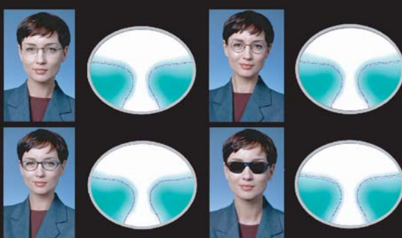
เลนส์โพเกรสซีฟระดับไฮเอนด์ ถ้าตรวจวัดประกอบอย่างถูกต้อง มุมมองจะกว้าง ใส่สบาย