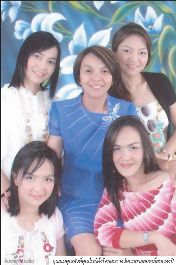
คุณแม่คุณฟงที่คุณโบบิตั้งใจมอบรางวัลแม่ยอดเยี่ยมแห่งปี

ขอเขาก็มาหาผมทุกคน หลังจากที่เขากลับสวีเดนไปแล้วประมาณหนึ่งเดือน เขาก็อีเมลล์มาบอกว่าแวนที่ผมทำให้ดีมาก ๆ และสั่งเพิ่มอีก ผมถามเธอว่ามีความสุขหรือเปล่านั้นผมสามารถแก้ไขปัญหาการมองเห็นให้กับคนอื่นได้เธอก็บอกว่ามีความสุข ผมก็บอกว่ารู้ไหมหลายๆ คนที่เขาได้เงินมากมายแต่ก็ไม่สามารถซื้อการมองเห็นที่ชัดทุกระยะได้ ถ้าหากผมทำได้แต่ผมไม่ทำเนื่องจากผมต้องทุ่มเทเวลาให้คนรัก เราจะไม่เห็นแก่ตัวไปหรือ และอีกอย่างผู้ชายจะประสบความสำเร็จได้อีกปัจจัยหนึ่งคือการมีคู่ชีวิตคอยให้กำลังใจและสนับสนุน เธอก็ O.K และบอกว่าจะช่วยทำให้ฝันของผมเป็นจริง หลายครั้งที่ผมท้อใจเวลาเจออุปสรรค ก็มีกำลังใจระดับสุดยอดจากคุณฟงนี่แหละที่หล่อเลี้ยงหัวใจให้เข้มแข็ง อีกเท็ม บ่อยครั้งที่เหนื่อยแทบขาดใจ ได้นอนตักคุณฟงสักกบ กอดคุณฟงไว้แน่นๆ สักพัก ก็มีพลังฟื้นคืนมาใหม่ (ยิ้ม) ถ้าไม่มีคุณฟงผมก็ไม่วันนี้นะ ะว่าอีกแปดปีจะเกษียณแล้วใช้เวลาส่วนใหญ่คอยปรนนิบัติตัวดูแลให้คุณฟงเป็นผู้หญิงที่มีความสุขที่สุดในโลกเลย (หัวเราะ)