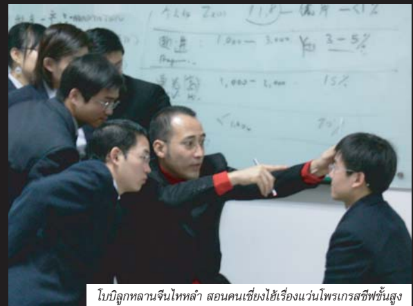
โบบิลูกหลานจีนไทหล่า สอนคนเชียงใหม่เรื่องแวนไพเรเกอร์สซึ้นสูง

ทุกวันนี้ไปเยี่ยมบ้านน้อยกลับบ้านปีละครั้ง โทรหาคุณพ่อแม่ก็ไม่บ่อย เดือนละครั้งสองครั้ง ตอนผมมีชื่อเสียงขนาดไปถึงสิงคโปร์ มาเลเซีย คุณพ่อคุณแม่ก็ยังไม่รู้ ถึงรู้เขาก็ไม่เชื่อ เขาจะเชื่อที่ๆ ผมมากกว่า วันที่เขามาเห็นศูนย์แวนดาโอซอพติค เห็นสิ่งที่ผมทำที่นี้ พ่อแม่ผมดีใจมาก ท่านพูดว่าท่านนอนตายตาหลับแล้ว ก่อนที่ผมจากบ้านมาผมบอกพ่อแม่ว่าผมจะทำให้ชื่อของคุณพ่อแม่เป็นที่รู้จักกับคนทั่วโลก เขาหัวเราะ เขาไม่เชื่อ ตอนที่ผมได้ไปสอนต่างประเทศครั้งแรก ผมโทรไปบอกพ่อแม่ ผมแปลกใจที่เขาไม่รู้สึกละอายใจ พ่อผมไปสอนเชียงใหม่ น้ำเสียงเริ่มดีใจ เป็นครั้งแรกในชีวิตที่คุณพ่อคุณแม่พูดว่าภูมิใจในตัวผม น้ำตาผมไหลด้วยความดีใจเลยนะ ร้องเลยดีใจมาก ผมดีใจที่ความสำเร็จของผมทำให้คุณพ่อคุณแม่มีความสุข ผมภูมิใจที่ผมได้เกิดเป็นลูกคุณพ่อคุณแม่