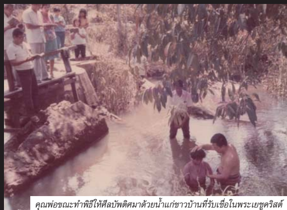
คุณพ่อขณะทำพิธีให้ศีลบัปติศมาด้วยน้ำแก่ชาวบ้านที่รับเชื่อในพระเยซูคริสต์

หลายปีที่คุณพ่อทำแวนสายตาคุณภาพสูงควบคู่ไปกับการรับใช้พระเจ้า ในชนบทจนเกิดคริสตจักรหลายแห่ง ความเชื่อในพระเจ้าและความมุ่งมั่นในการทำแวนสายตาของคุณพ่อก็มีอิทธิพลกับผมมากที่สุด ก่อนนอนทุกคืน คุณพ่อจะจับมือสอนพวกเราทุกคนอธิษฐาน ทุกวันอาทิตย์แปดคนพี่น้องเดินเป็นพรานตามคุณพ่อไปนมัสการพระเจ้าที่คริสตจักรตรังโดยมีคุณแม่ปัดท้าย คุณพ่อสอนพวกเราเสมอว่า "ให้สัตย์ซื่อต่อพระเจ้า ครอบครัวเราวันนี้ได้เพราะพระเจ้าทรงอวยพระพร" พ่อปลุกฝังผมเรื่องการทำแวนว่า "ทำแวนต้องวัดให้แม่นยำ ใช้เลนส์และกรอบคุณภาพที่ดีที่สุด ประกอบเที่ยงตรงสวยงามปราณีตที่สุด ถึงราคาจะแพงกว่าหลายสิบเท่าแต่คุณภาพดีจริง ลูกค้ายิ่งซื้อ" หลายสิบปีมานี้ ลูกค้ายของคุณพ่อหลายหมื่นคนได้พิสูจน์แล้วว่า คำสอนของคุณพ่อเป็นจริง