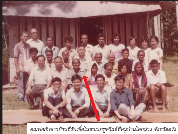
คุณพ่อกับชาวบ้านที่รับเชื่อในพระเยซูคริสต์ที่หมู่บ้านโคกม่วง จังหวัดตรัง

คนร้ายจึงไม่กล้าลงมือ เมื่อคุณพ่อกลับออกมา พวกคนร้ายแกล้งถามว่า "ฝรั่งที่มาตามหาคุณพ่อย้ายไปไหน" คุณพ่อก็ยิ้มแล้วตอบว่า "เป็นทูตสวรรค์ที่พระเจ้าส่งมาคุ้มครองผม" พวกคนร้ายจึงล้มเลิกแผนเรียกค่าไถ่ ต่อมาพวกเขากลับใจมาเชื่อพระเจ้า จึงเล่าเรื่องราวที่เคยคิดร้ายกับคุณพ่อให้ฟัง